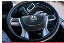
Mandos en el timón