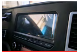
Radio MP5 con pantalla táctil