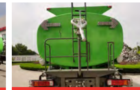
Cañón de agua